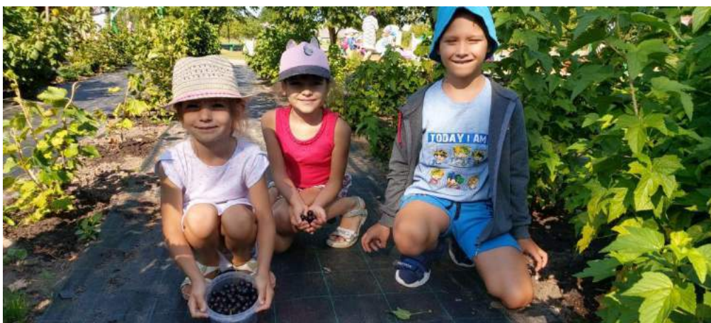
Attēlā – upeņu lasīšana

Dzīve nesākas un nebeidzas bērnudārzā, tāpēc mums nozīmīgi ir rūpēties arī par mūsu pilsētvidi un īpaši - tās zaļo zonu. Bērnu instinktīvi interesē daba un tās procesi, tāpēc ir viegli aizraut ar aktivitātēm dabā, kas arī sniedz vislielāko ieguldījumu. Jo vislabāk mēs mācāmies tieši tad, kad esam ieinteresēti. Iziet ārpus bērnudārza teritorijas ir notikums, un vēl lielāks notikums ir tad, ja ir interesants mērķis – pīļu barošana dīķī, putnu būru uzstādīšana parka kokos, fiziskās aktivitātes, tematiskās ekspedīcijas u.c. Ar lielu interesi bērni dodas piedzīvojumu ekspedīcijās ar īpašu šai aktivitātei iegādātu ekipējumu – binokļiem, fotokameru, lupām. Ekspedīciju ietvaros parka teritorijā tiek izzināta daba, atrodamie dabas materiāli tiek ievākti un pētīti, veicinot zināšanas par dabas procesiem un bioloģiju.